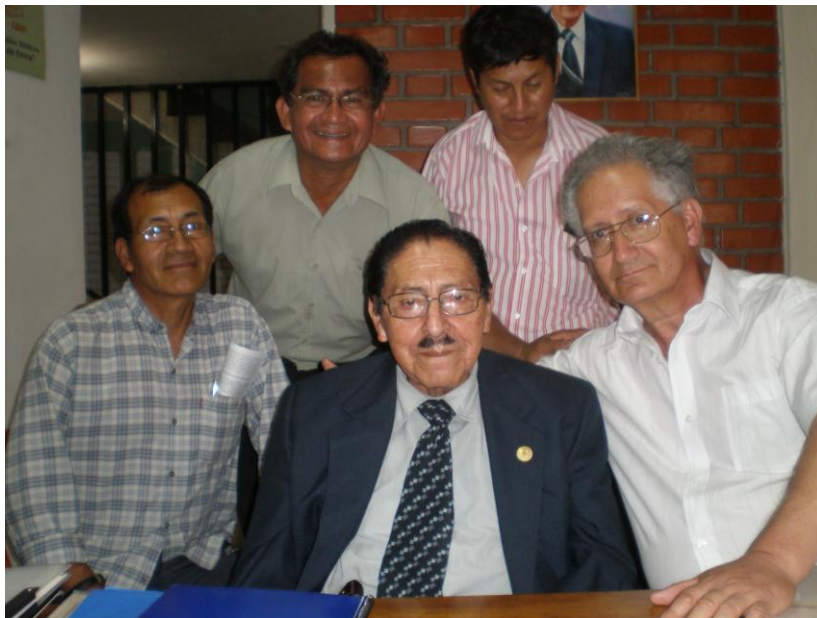
Su Santidad el Papa Chale I en el centro, rodeado de sus adoradores charapas, ya vuelta.