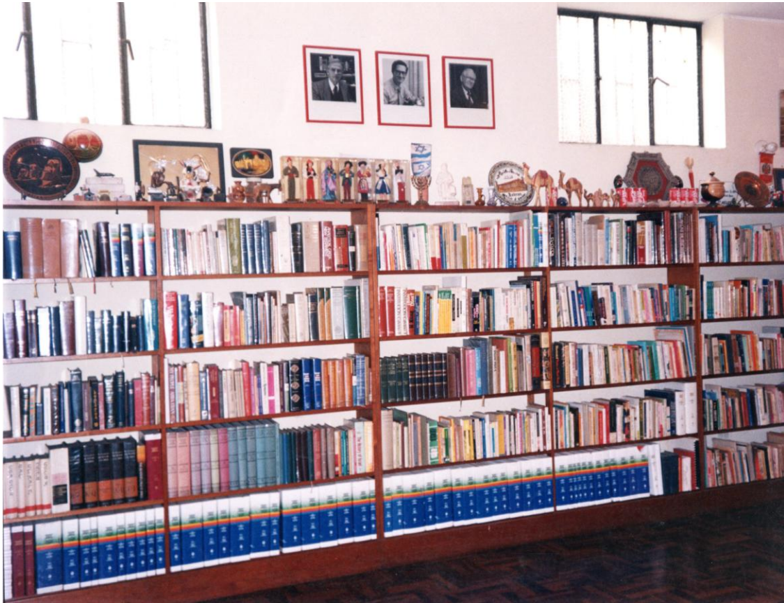
VISTA PARCIAL DE LA BIBLIOTECA INTELIGENTE (Al pie, empastados en color azul están los originales de la Biblia RVA)