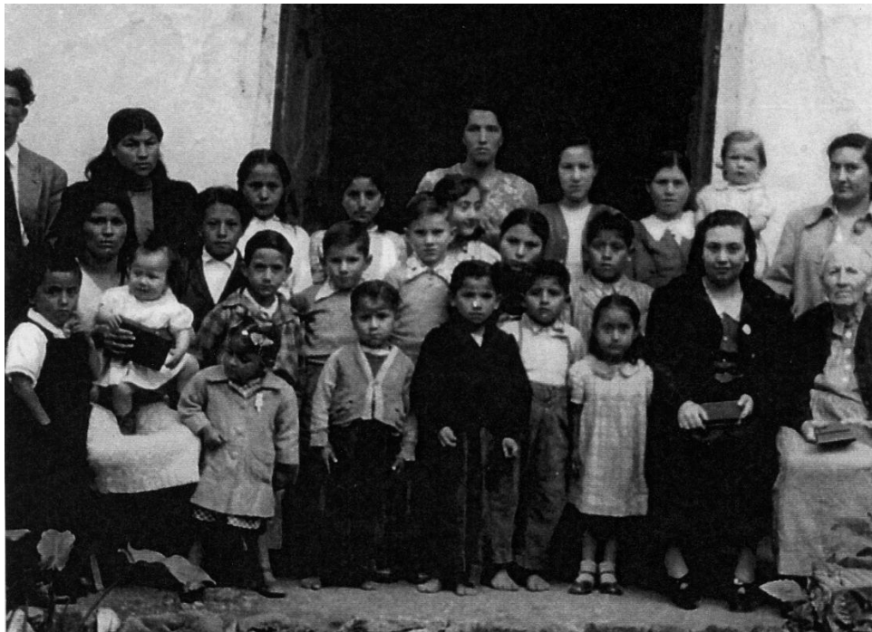
El cabezón de camisa a cuadros es el Autor del Test