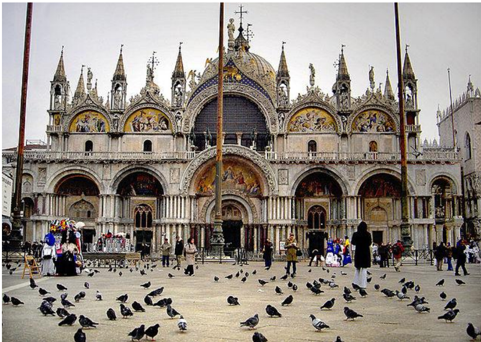
Portentosa Basílica de San Marcos en Venecia, Italia