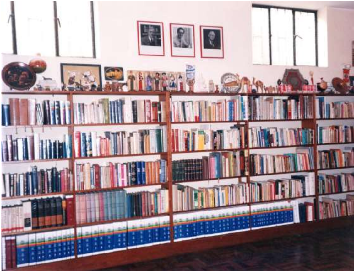
VISTA PARCIAL DE LA BIBLIOTECA INTELIGENTE Y DEL MUSEO DE LA BIBLIA DEL CEBCAR Al pie, empastados en color azul, están los originales de la Biblia RVA y de la Biblia Decodificada