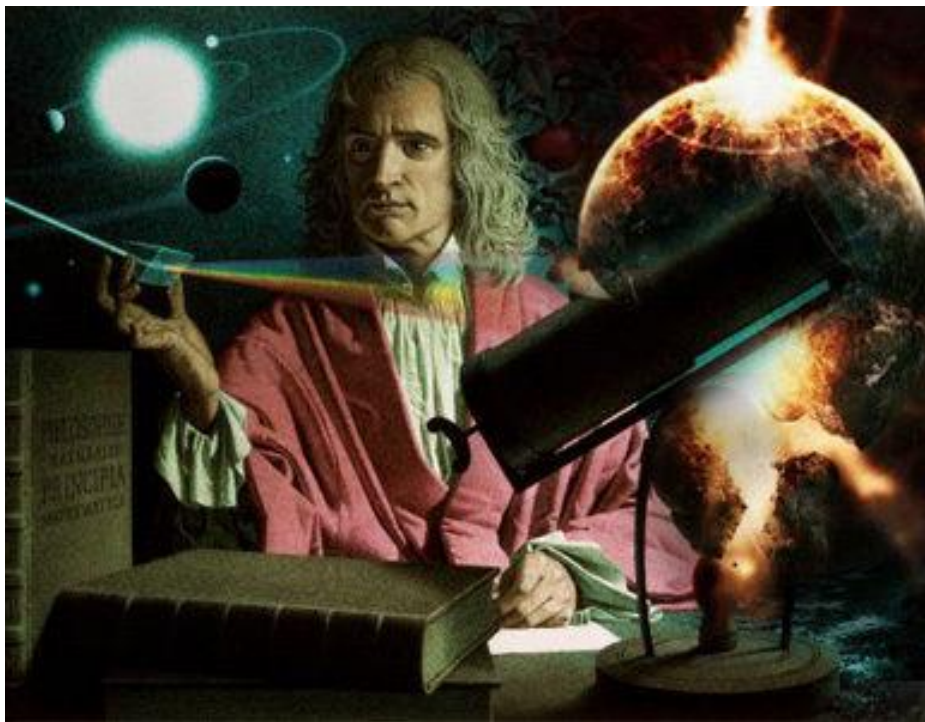
Isaac Newton, prototipo de los evangélicos de todo el mundo